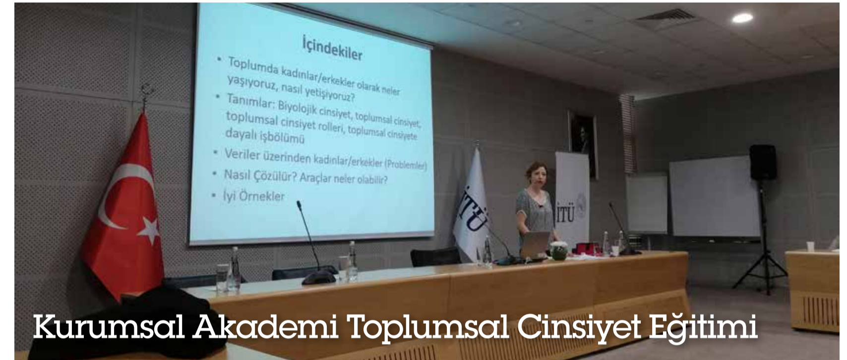
Kurumsal Akademi Toplumsal Cinsiyet Eğitimi